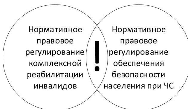
Рисунок 2. Локализация проблематики безопасности инвалидов при ЧС

Очевидно, что проблематика безопасности инвалидов при ЧС располагается на пересечении двух нормативных правовых областей, одна из которых регламентирует правоотношения в сфере комплексной реабилитации инвалидов, а другая — правоотношения в сфере обеспечения безопасности населения при ЧС (рис. 2).