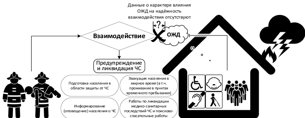
Рисунок 3. Схема влияния ОЖД на взаимодействие инвалидов с силами и средствами системы предупреждения и ликвидации ЧС

ОЖД и методика определения их наличия у человека достаточно подробно описаны [16, 17]. С информацией об имеющихся установленных у инвалида ОЖД можно ознакомиться, например, в его индивидуальной программе реабилитации и абилитации [18]. Очевидно, что эти ограничения будут оказывать негативное влияние на взаимодействие инвалида с силами и средствами системы РСЧС в ходе реализации соответствующих мероприятий, но в какой мере? Сильно или слабо? При выполнении каких мероприятий сильнее, а при каких слабее? А как и чем это влияние можно измерить? Ответов на эти вопросы в литературных источниках нами не найдено.